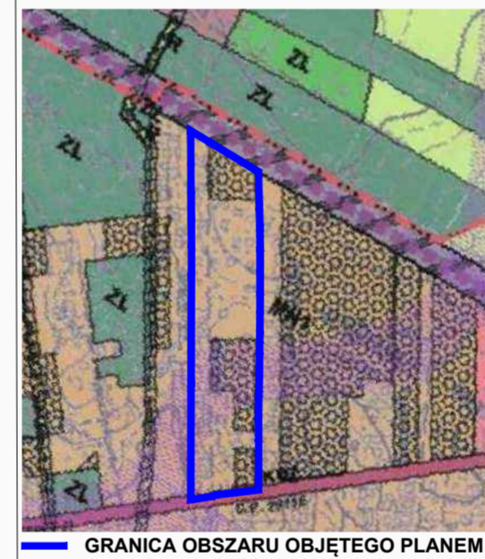
GRANICA OBSZARU OBJĘTEGO PLANEM