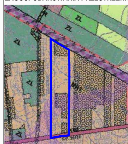
GRANICA OBSZARU OBJĘTEGO PLANEM